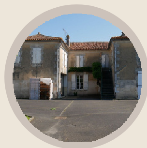
POUR LE COLLÈGE DE PÉRIGNAC

WWW.GRAINESDARCENCIEL.ORG @GRAINESDARCENCIEL