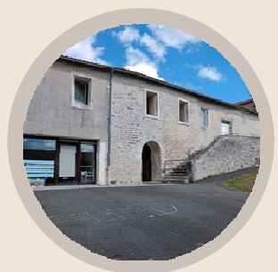
POUR L'ÉCOLE DE CHADURIE